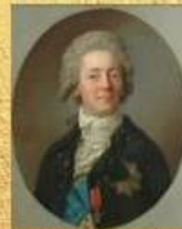
Stanisław Kostka Potocki (1755-1821), polityk, generał, kolekcjoner