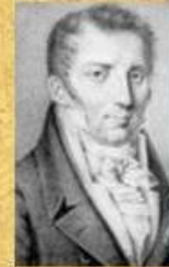
Tadeusz Wiktoryn Matuszewicz (1765-1819), polski mówca, publicysta, tłumacz, poeta, polityk