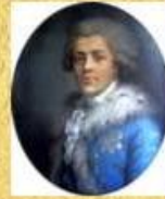
Ignacy Potocki (1750-1809) - jeden z twórców Konstytucji 3 Maja 1791