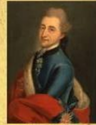
Adam Tadeusz Stanisław Naruszewicz (1733-1796)