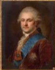
KRÓL Stanisław August Poniatowski (1732-1798), inicjator prac nad projektem reform rządowych w okresie XII 1790-2 V 1791