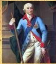
Stanisław Małachowski (1736-1809), Marszałek Sejmu Wielkiego