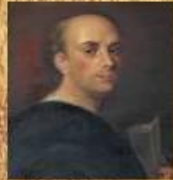
Scipione Piattoli (1749-1809) włoski prawnik związany z polskim dworem królewskim, zwolennik reform w Polsce

Twórcy Konstytucji 3 Maja - uczestnicy tajnych spotkań, na których opracowywano projekt Konstytucji 3 Maja w okresie grudzień 1790 - maj 1791