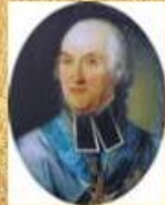
Stanisław Warzyńiec Staszic (1755-1826), pisarz, polityk