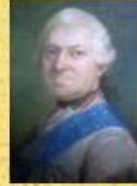
Andrzej Hieronim Zamoyski (1716-1792), kanclerz wielki koronny