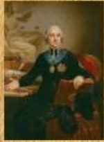
Hugo Kołłątaj (1750-1812) - kontrowersyjny twórca Konstytucji 3 maja