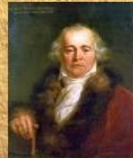
Julian Ursyn Niemcewicz (1758-1841) poseł na sejm, publicysta, pisarz i uczyony. Jeden z wybitnych przedstawicieli polskiego oświecenia

Twórcy Konstytucji 3 Maja - uczestnicy tajnych spotkań, na których opracowywano projekt Konstytucji 3 Maja w okresie grudzień 1790 - maj 1791